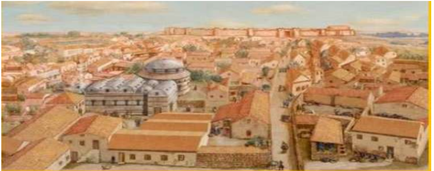
Αναπαράσταση του Βυζαντινού Αμορίου με βάση τις ανασκαφές