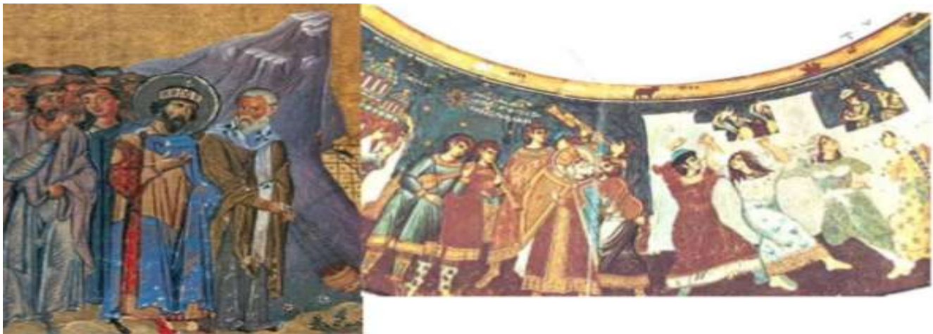
▲ Ο αυτοκράτορας Μιχαήλ Γ' ανάμεσα σε δασκάλους και φοιτητές του Πανεπιστημίου