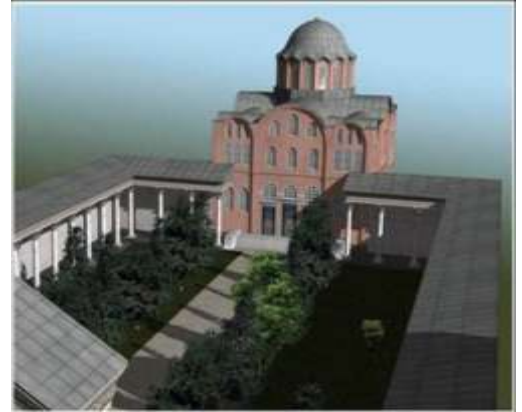
Η Σχολή της Μαгнаύρας