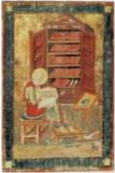
◀ Ο Προφήτης Έσδρας. Χαρακτηριστική σκηνή εργασίας βυζαντινού λογίου. Μικρογραφία χειρογράφου της Δαυρεντιανής Βιβλιοθήκης της Φλωρεντίας

Αναζητώ, συλλέγω, μελετώ, αντιγράφω χειρόγραφα με έργα της αρχαίας γραμματείας.